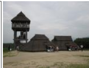
物見櫓と竪穴式住居

最初の見学地は、佐賀県の吉野ヶ里歴史公園です。吉野ヶ里歴史公園は長い弥生時代のすべての時期の建物が残された遺跡です。まず、竪穴式住居、物見櫓、北内郭、高床倉庫を見学しました。次に、勾玉づくりを体験しました。世界に一つだけ、自分だけの勾玉づくりに、集中して挑戦しました。