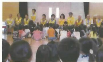
スクールヘルパーさんの紹介