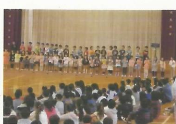
1年生のお礼の言葉と詩