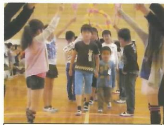
6年生と手をつないで入場

入学して、1か月が過ぎました。1年生は元気に登校してきています。学校生活にも少しずつ慣れてきました。5月6日(金)には、「1年生を迎える会」が開かれました。学年はじめの忙しい時ですが、5・6年の運営委員会の児童が中心となって、会を計画し、進めてくれました。1年生は、はじめは何が始まるのだろうと、目を丸くしていました。歓迎の言葉、歓迎の歌、ゲーム(学校生活のクイズ)と会が進むにつれて、とても楽しそうな表情にかわってきました。そして、会を開いてくれたことにお礼を言い、元気いっぱい「1年生になったら」を歌ってくれました。また、折尾東小学校では、「1年生を迎える会」で、1年間子ども達の学校生活を見守ってくださる「スクールヘルパー」さんを紹介します。「よろしくおねがいします!」とみんなで挨拶をしました。