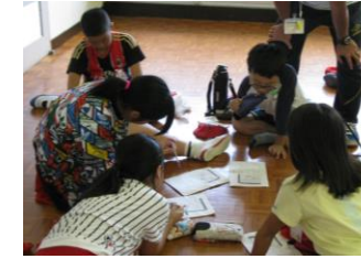
班での俳句づくり