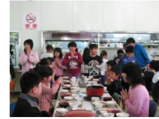
セルフサービスで食事