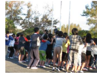
タベのつどいでのゲーム