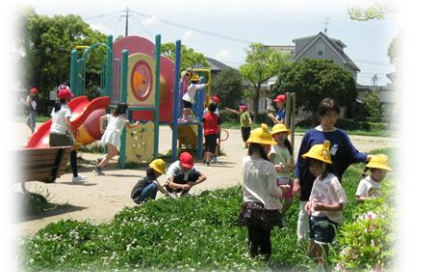
1年生と6年生で遊びました。