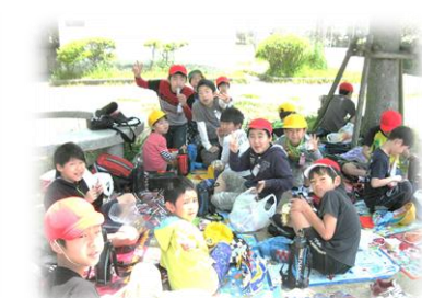
歓迎遠足のお弁当タイムです。