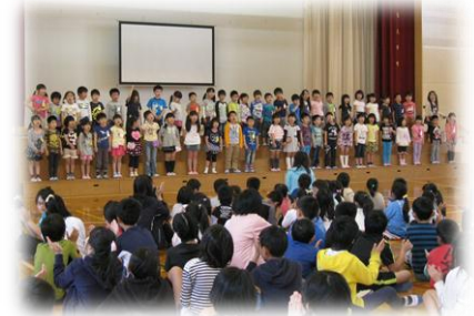
1年生のお礼の言葉と歌です。