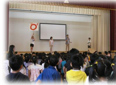
〇×クイズで盛り上がりました。