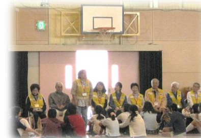
ヘルパーさんよろしくお願ひします。