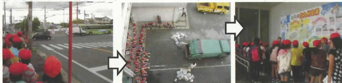
3年生 まち探検 6/4

こんなふうにして、子ども達は自分自身からスタートして、少しずつ世界を広げていきます。その中で、自分自身を充実させ伸ばしていくことと、社会の一員としての自覚やみんなのために動くことができる人として育っていきます。 自分・人・世の中、これらは成長の大切なキーワードです。