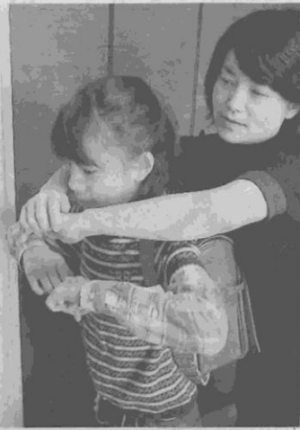
後ろから抱きつかれたら、両ひじを横にはね上げて相手の腕から逃げる

まためによると、発生時間6~10時も8件ずつあった。発生場所別では「道路」の38件が最多で、「マンションやアパートなどの