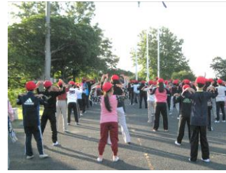
朝の集いでの体操