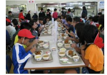
セルフサービスで食事