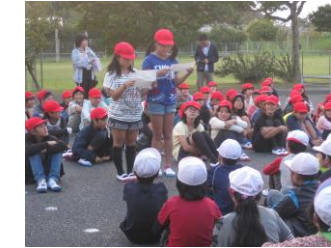
学校紹介(代表や係の仕事)