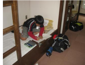
部屋で日記を書く