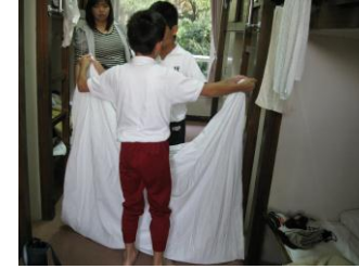
協力してのシーツたたみ