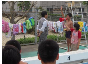
プール開きの様子