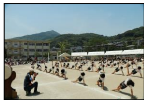
【がんばって練習した5、6年生の組体操】