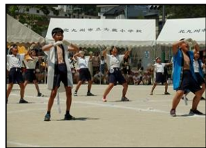
【迫力があつた応援団】

保護者の皆様には、練習期間中から当日まで温かいご声援をいただき、子どもたちには心強い応援になったことと思います。また、21日夕方の児童席テント張り、そして当日の撤収にもたくさんの皆様にご協力いただき、本当にありがとうございました。