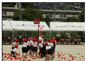
【1年生、初めての玉入れ】