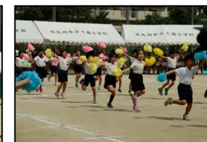
【1、2年生かわいいダンス】