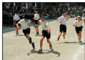
【全員で応援した紅白リレー】