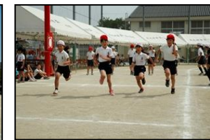
【全力で走った4年生かけっこ】