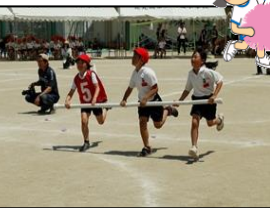
【3年生の「ハリケーン」】