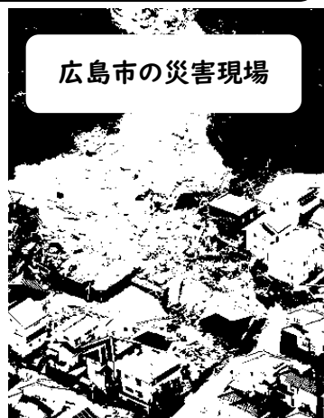
広島市の災害現場

校長先生も木曜日から日曜日まで学校(当時は洞北中学校)に泊まり込んでいましたが、金曜日の朝はとても恐怖を感じました。短時間でみるみるうちに学校の前の水路の水位が上昇し、田んぼはあっという間に見えなくなりました。バイパスや芦屋に抜ける幹線道路も冠水し、とても走れる状態ではありませんでした。頭では分かっている、いざ現場を目の前にすると混乱すると思います。この豪雨を「他山の石」と考えず、日頃から意識していくことが大切だと感じました。