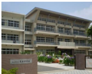
尾倉中学校だより