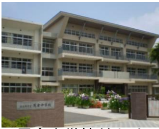
尾倉中学校だより