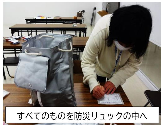
すべてのものを防災リュックの中へ