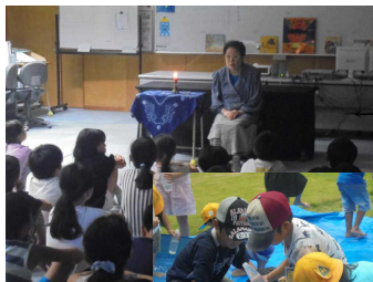
か〇読み聞かせ(全学年)

今年で最後となる「夏の教室」では、ボランティアの皆さんによる読み聞かせや様々な活動が行われました。来年度からは、夏休みの短縮に伴い、「夏の教室」がなくなります。