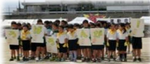
1・2年生の表現「ス・マ・イ・ル」

数日前から「光化学オキシダント」値が高く、気温も上昇し夏になるという予報が出される中、保護者の皆様、地域の皆様のご理解・ご協力を得て、大きなトラブルもなく、5月26日（日）に運動会を無事に終了することができました。ありがとうございました。子どもたちは2週間の練習に一生懸命取り組み、その成果を発揮することができました。最後まで全力でがんばる姿や、仲間と協力したり応援したりする姿に、「力をあわせて 心を一つに 50周年」のスローガンが達成できたと考えております。また、運動会の準備や係活動、応援団の5・6年生も素晴らしい活躍でした。学校では、子どもの運動会でのがんばりや取組の成果を今後の学校生活に活かしていきます。今後とも本校学校教育へのご理解とご支援、よろしくお願いたします。