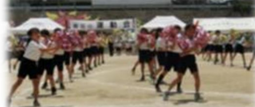
3・4年生の表現「ホメチギリスト」