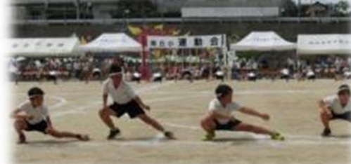
5・6年生の表現「ソーラン節」