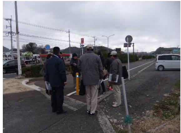
【新門司（フェリー）交差点付近】

合同点検では、路面表示の設置、ポールを設置など安全対策の必要な箇所について、確認を行いました。また警察にも交差点などの巡回を依頼しました。