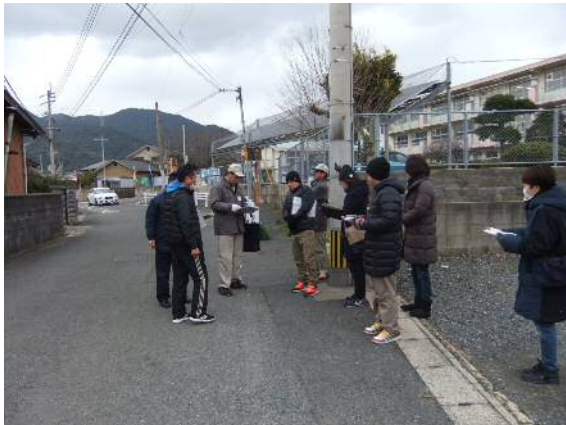
【松ヶ江北小学校付近】