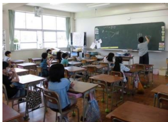
（3年：理科の勉強です）

北九州市での新型コロナウイルスの新たな感染者が減少していますが、18日（木）までは分散登校です。児童の皆さんは午前中3時間の学習に、少人数ですが元気に取り組んでいます。