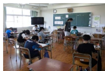
（5年：算数の勉強です）