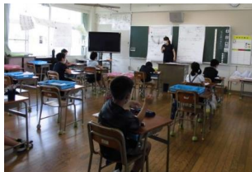
（4年：算数の勉強です）