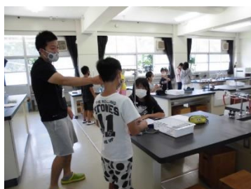
（6年：理科の実験です）