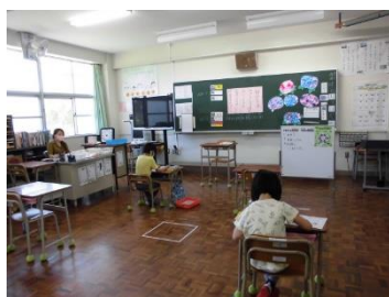
（ひまわり学級：国語です）