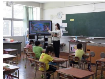
（1年：国語の教科書で学習）