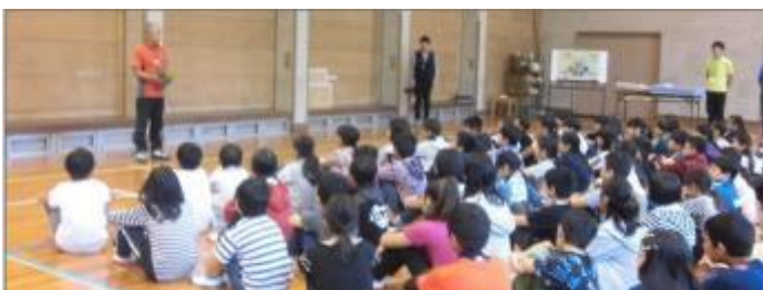
【かぐめよし少年自然の家・10月9日(火)～10日(水)】

様々な体験を通して、子ども達は更に大きく成長したことでしょう。これからの活躍も楽しみです。