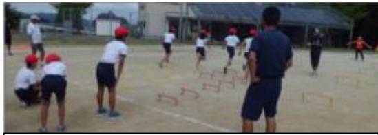
陸上競技のゲスト・ティーチャーから指導を受ける6年生

みんなで協力してがんばった6年生は、黒畑小の誇りです。とても素晴らしかったです。