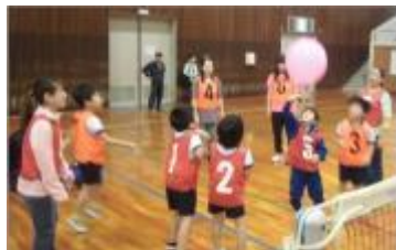
黒畑小の代表としてがんばりました。

「黒畑キッズ」「黒畑ファイターズ」の2チームは、黒崎中央小・引野小と対戦し、好成績をおさめました。よくがんばりました。