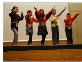
【6年生のメッセージ劇】