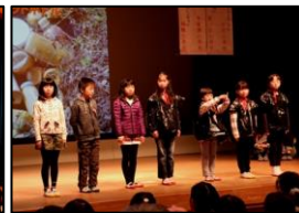
【宿場踊りの振り付けて踊った「ほたるこい」】