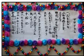
【集会のプログラム】

尚、「6年生を送る会」の様子を伝える写真をホームページに載せています。ぜひ、全校児童で盛り上がった集会の様子をご覧ください。