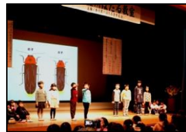
【自分たちが調べたホタルについて発表】

発表の最後には、童謡「ほたるこい」の歌に合わせて宿場踊りを踊り、会場から大きな拍手をもらいました。この発表の通り、木屋瀬小学校の校区にもホタルがやってくるように、環境をしっかり守っていかねばならないと思いました。3年生の皆さん、よく頑張りました!