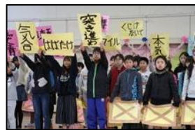
【5年生のメッセージ】