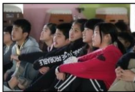
【思い出のスライドを見る6年生】