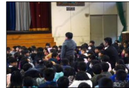
【みんなの前で発表する子どもたち】

3学期は、学年のまとめの学期であるとともに、次の学年へ向けての準備の学期でもあります。どの学級でも、子どもたちがお互いの考えを交流し合いながら、だれもが自分の考えを発言することが出来る学校づくりを進めていきたいと思えます。このことが、やがてはいじめのない、だれもが楽しく学び、楽しく生活することが出来る木屋瀬小学校につながる近道だと思います。