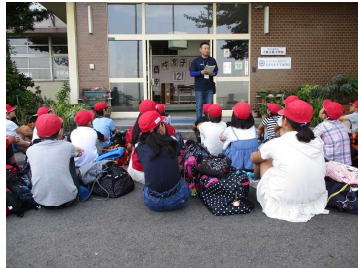
9月13日(水) 出発式 りっぱな態度で臨むことができました。