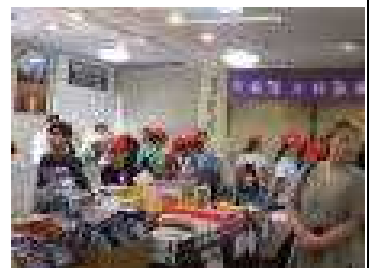
1回目のショッピングタイム 昼食後、お土産等購入。