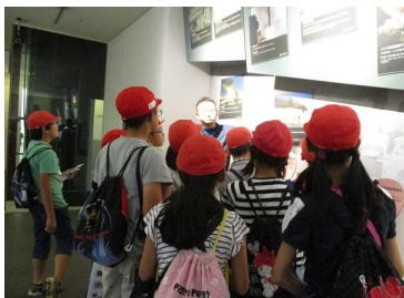
長崎原爆資料館 ワークシートを活用してしっかり学習。