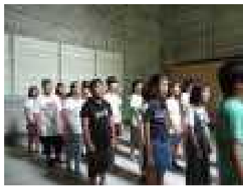
国立長崎原爆死没者追悼平和祈念館 平和集会。全員で黙祷をしました。