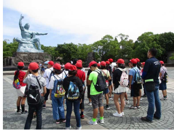
平和祈念像 間近で見て、その大きさに目を見張る!