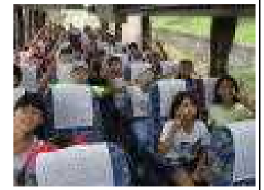
バスの中 和気あいあい。これはおやつタイム