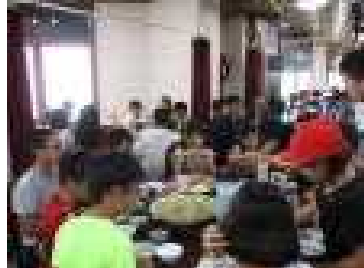
中華料理 ランチ 龍屋本舗。円卓。もちろん皿うどんあり。