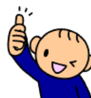
イラスト：ドロップレット