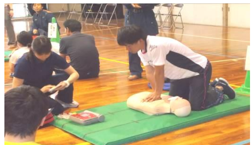
がっ 6月4日（火）救命救急研修

ぜんしよくいん 全職員で、今週から始まる水泳学習に向け プールをピカピカに掃除しました。