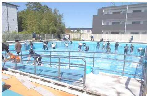
がっ 5月29日（水）プール清掃

ぜんしよくいん 全職員で、今週から始まる水泳学習に向け プールをピカピカに掃除しました。