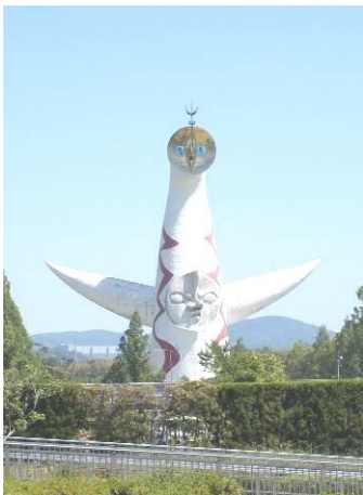
なつかしの太陽の塔が見えました。 「こんにちは♪ こんにちは♪」

中学部は、旅行の途中で「働く人」にインタビューをするなどして、学んだ事を実社会で生かす(学を修める)修学旅行から、また、新たな多くのことを学んでいました。