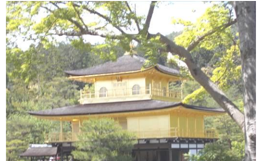
写真撮影スポットから観た金閣寺

1 日目は、金閣寺や太秦映画村を見学しました。 金閣寺では、観光客が多かったものの、運良く、その黄金に輝く姿をはっきりと観ることができました。息を呑むような美しさに感動していました。