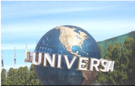
USJ シンボル地球儀の前は 写真撮影ラッシュでした。

2 日目は、USJ (ユニバーサルスタジオジャパン) で終日過ごしました。目的の乗り物に乗って喜ぶ生徒や、家族へのお土産を一生懸命に探す生徒の姿から、修学旅行を心から楽しんでいる様子がうかがえました。特に、デザートタイムで、甘い物を食べて、笑顔で友だちと語り合う姿から3年間共に学んできた、学年のチームワークの良さが伝わってきました。