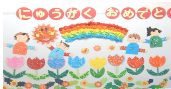
しょうがくぶ ねんせい きょうしつけいじ 小学部1年生の教室掲示