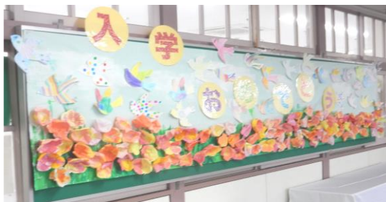
げんかんうけつけ けいじ 玄関受付の掲示