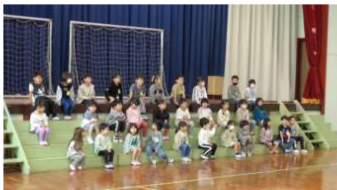
入場直後。おりこうさんに待っています。