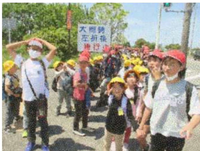
いっぱい遊んで大満足で帰ります！

※予定は変更となる場合があります。その場合は、改めて連絡いたします。 ★マークは、お弁当が必要な行事です。ご準備をよろしくお願ひします。