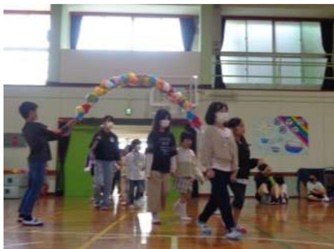
ドキドキしながら入場です！

その後、全員でひびきコスモス運動場に向かいました。6年生に手を引かれた(一部5年生も協力)1年生を先頭に、全員で向かいます。晴天の下、心地よい風に吹かれながらの遠足は、本当に気持ちのよいものでした。こうして以前のように、一つ一つ思い出を積み上げていく学校生活に戻ったことに、感慨もひとしおの1日でした。