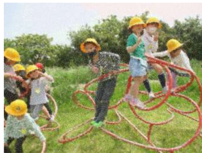
変わった形の遊具もだいじょうぶ！