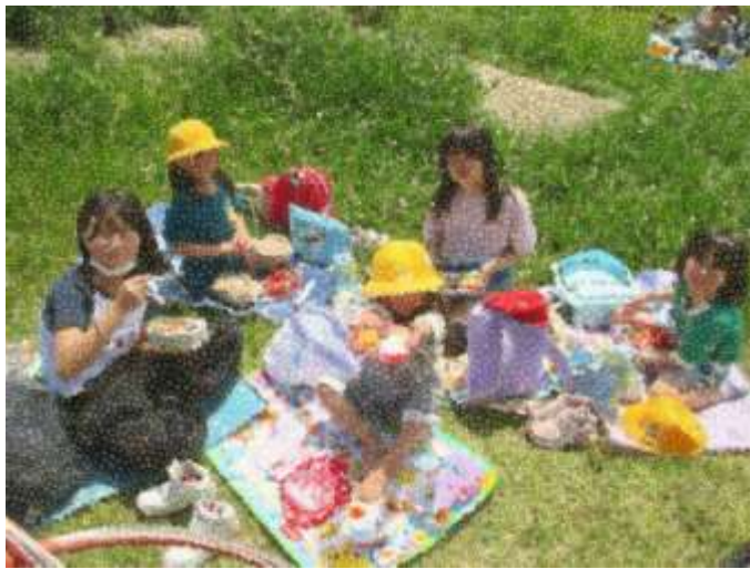
お姉ちゃんたちと食べるお弁当はおいしいね