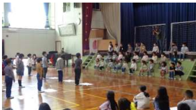
各学年とも、趣向を凝らした出し物でした