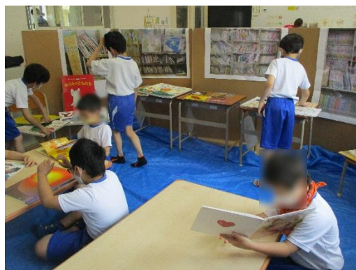
↑ 図書館へ行こう in こいけ