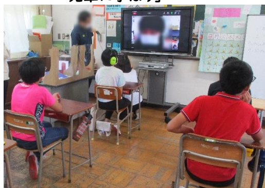
↑ 7/20 オンラインで前期前半まとめの会 ↑