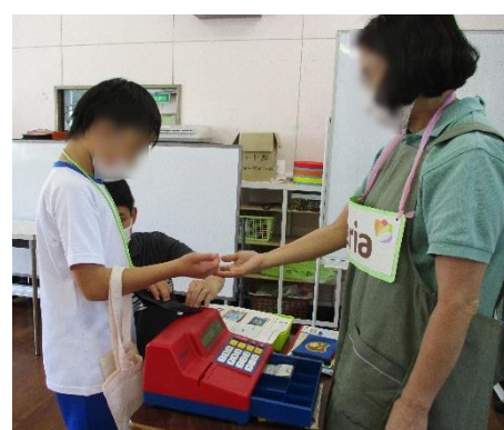
↑ 100 円ショップで買い物をしよう