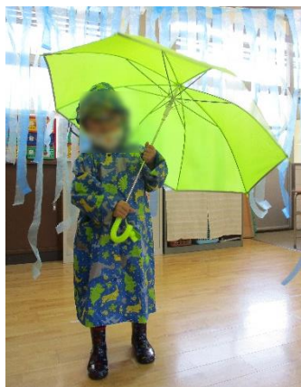
↑ 雨の日 体験