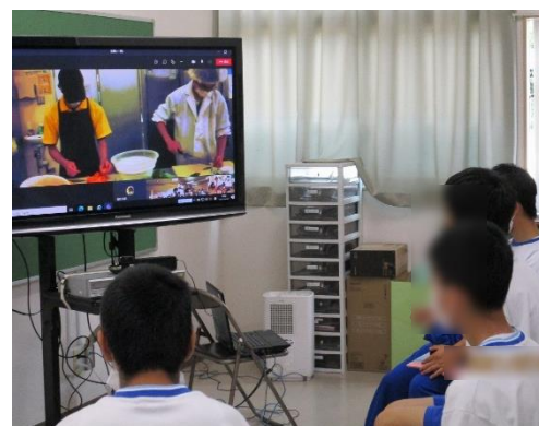
↑ 高等部：実習先からオンライン中継