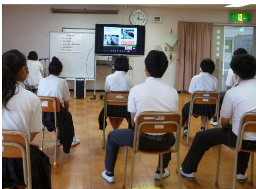
↑ 高等部：オンラインで実習報告会