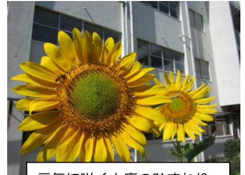
元気に咲く中庭のひまわり

夏休み中ののんびりした生活から、一気に体育大会の練習に入ったため、心と体のバランスを保つよう自分で管理するのも勉強です。