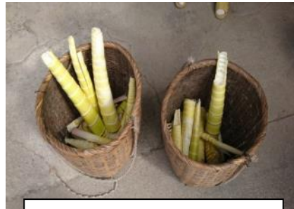
山で採ってきた竹の子