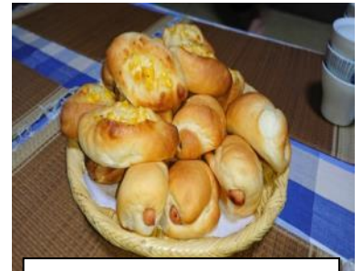
お母さんと作ったパン

受け入れ家庭の方々には「雨の日は何をしよう」、「これを食べさせよう」と生徒を迎えるために様々な準備をしていただきました。