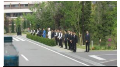
従業員総出のお見送り

旅館・能楽堂・薬師寺など訪れたところの方から、あいさつがしっかりできて気持ちがいよとの言葉をいただきました。ホテルを去る時は、従業員の方が総出でバスをお見送りいただき、その温かいおもてなしの気遣いにみんなで感動しました。