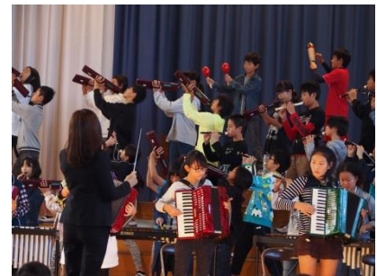
6年「ラスト・ステージ」