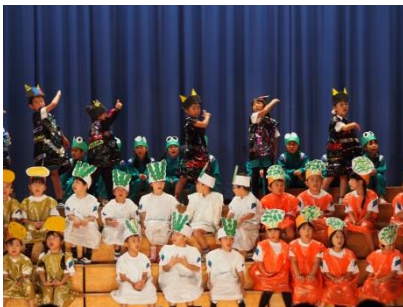
1年「はたけのしたはおおさわぎ」