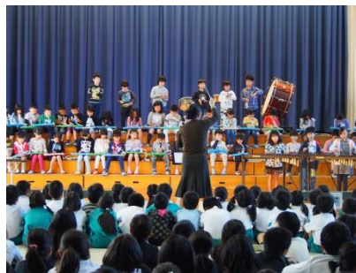
2年「なかよし音楽会」