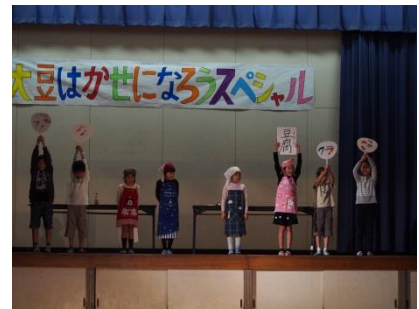
3年「大豆はかせになろうS」