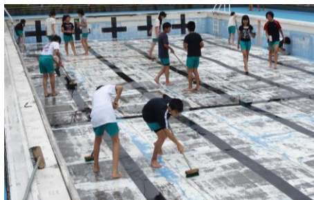
6年生プール掃除の様子

6月13日(金)にプール開きを行いました。6月10日(火)にプール清掃を行った6年生が代表してプール開きに参加しました。水泳学習の安全を祈願した後、初泳ぎを楽しみました。16日(月)から、その他の学年も水泳学習が始まりました。