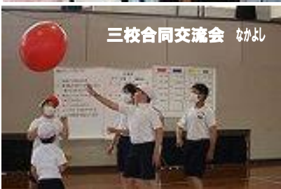
三校合同交流会 なかよし