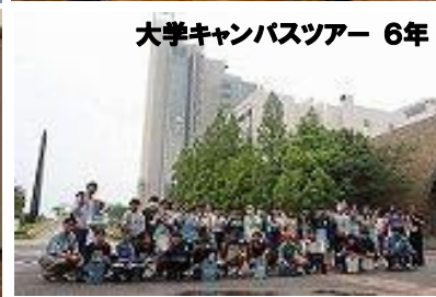
大学キャンパスツアー 6年