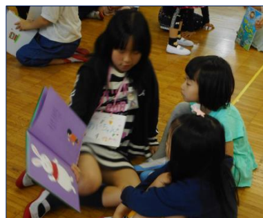
<1年生に読み聞かせをする6年生>