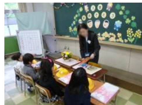
<入学式の日 教室での様子>

4月10日（金）に入学式を行い、61名の新1年生が入学してきました。これで全校児童がそろい、315名になりました。