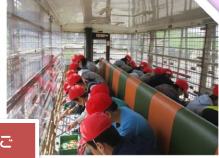
アフリカンサファリ、うみたまご