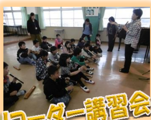
リコーダー講習会