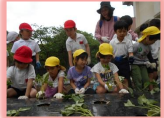
ほいくしょといっしょに、 おいもをうえました。