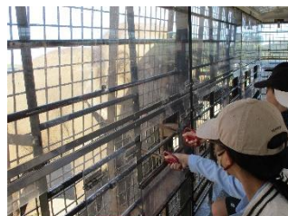
アフリカンサファリ えさやり体験

修学旅行を終えて、これからは22日の「収穫祭」に向けてどの学年も練習に取り組んでいきます。一人一人が、自分の力を発揮して、地域・保護者の皆様に感謝の気持ちを伝える会になるよう頑張っていきます！