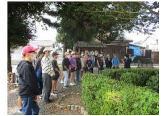
大刀洗平和記念館・頓田の森平和花園