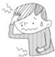
痛いところがある (頭やおなかなど)