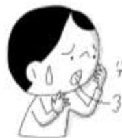
なやんでいることがある