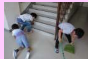
2年生 保健室横階段掃除

昼休みが終わると、15分間の清掃活動を行います。おそうじ名人は、「すばやくとりかかり、時間いっぱい、最後までもくもくと丁寧におこなう。」となっています。どの掃除区域においても、子ども達が、もくもくと一生懸命に掃除をしている姿を見かけます。掃除も大切な教育活動の1つです。「学校もきれい。心もきれい。クリーン 一枝小」をめざしていきます。ご家庭でも子どもと一緒に掃除をしましょう！