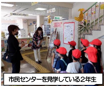
市民センターを見学している2年生