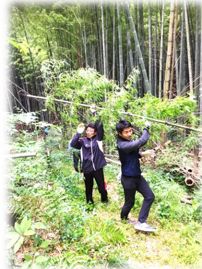
地域の方々、先生方と共に険しい竹山に入り竹取りをしました。

祇園町商店街にて「七夕のゆうべ」が開催されました。 毎年、花尾小学校と共に、PTAも準備から参加しています