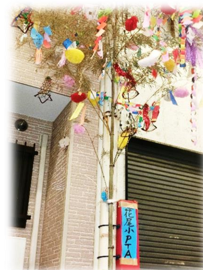
祭り会場となる祇園町商店街が、 笹飾りで彩られ、子どもたちの願い があふれています