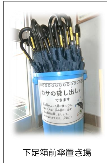
下足箱前傘置き場