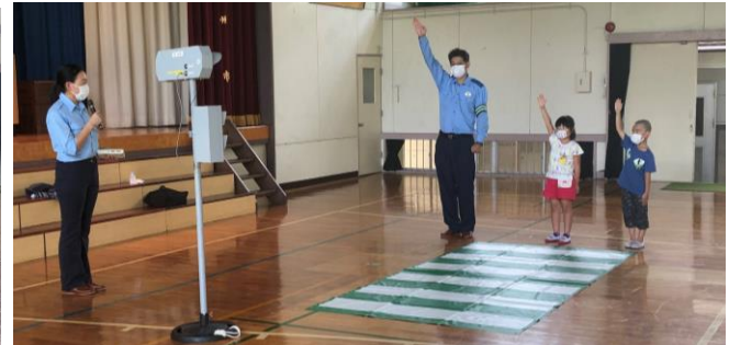
いよいよ本番 きんちょうするね