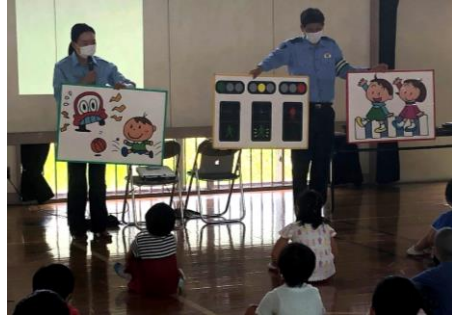
飛び出し禁止や信号機の見方について聞きました