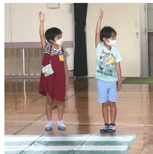
青になってもあわてずに