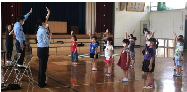
横断歩道の渡り方：その場でやってみよう