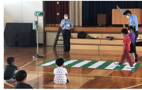
しっかり手をあげてわたりましょう