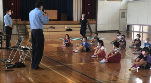
三密に気をつけて座っています