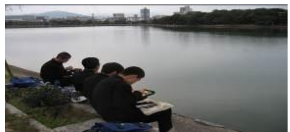
大濠公園 昼食 「行儀よくたべていました」