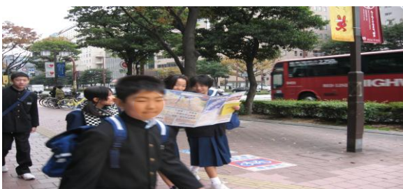
地図を見ながら「ここどこ！」 博多駅は後方

12月7日(水)2年生は、来年の修学旅行の事前学習を兼ねて、福岡市内班別研修をおこないました。慣れない見知らぬ土地を班員が地図を頼りに、知恵を出し合い目的地に安全に到着できることを目的としました。生徒たちだけの行動となるので、自分たちで安全を確保しながら班員が協力することが重要ですが、地下鉄構内や、地上を歩く姿を追っていましたが、どの班も男女が離れることなく安全に歩いていました。農村宿泊体験でも素晴らしい行動がとれていましたが、今回も見事に目的を果たすことができたと思います。