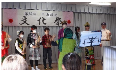
民族楽器にチャレンジ

11月11日～12日は、市民センターの文化祭でした。学校からは、4年生とダンスクラブが歌唱の動画、3年生が工作の作品展示を行いました。また、中学生ボランティア(二島小出身の生徒もいます)が、文化祭を手伝ったり、イスラム文化を伝える合奏で演奏したり、合唱部の舞台もあつたりと、小中学生の活躍が多くみられました。また、小学生も文化祭に参加し、動画視聴では楽しそうに見ている姿が印象的でした。