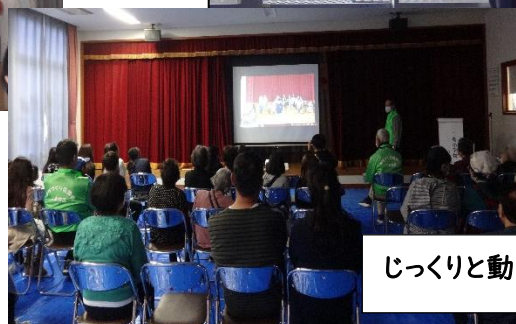
じっくりと動画鑑賞!大きな拍手!!