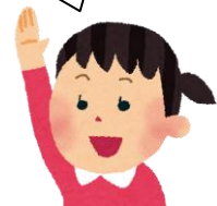
「よい子の社会科」13号

しくみ図から、消防署や警察、水道局など、多くの人が火事を消したり、けがをした人を病院に運んだりするために、協力しながら活動していることがわかります。だから、すばやく現場にかけつけ、火事を消したり、けがした人を病院に運んだりすることができるのだと思いました。