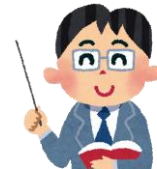
しょうぼうしれい れんらく 消防指令センターからの連絡のしくみ