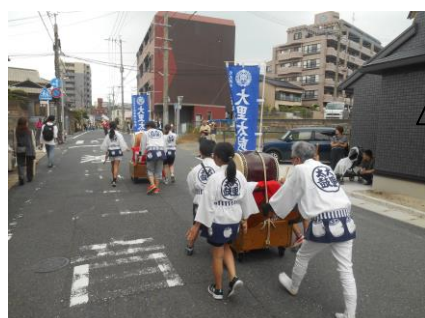
門司みなと祭りの大里地区パレードに、大里太鼓クラブが出場しました。沿道からの声援を受けながら、5名の児童が、太鼓をたたきながら歩きました。

今までは、学校だよりをA4の紙に印刷して配布しておりましたが、今月号から tetoru での配信にしてみようと考えました。現代の社会動向に合わせて、少しずつですが、このような形に変えていくのも「業務改善」の一手につながるのかな?なんて考えました。もちろん、ホームページにも掲示いたします。そのうち、学年だよりレベルまでは配信できるかも?です。どうぞ期待!!!