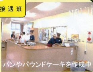
パンやパウンドケーキを作成中