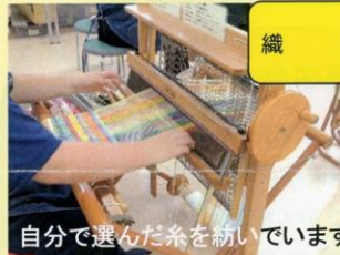
自分で選んだ糸を紡いでいます