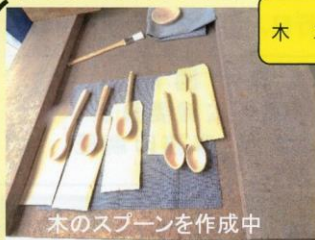
木のスプーンを作成中