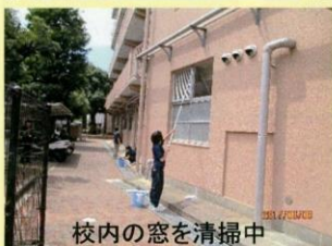
校内の窓を清掃中