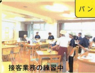
接客業務の練習中