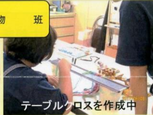
テーブルクロスを作成中