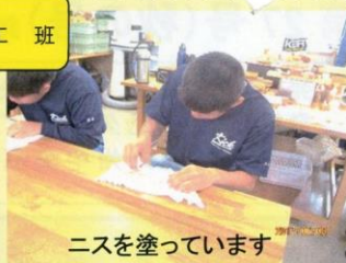
ニスを塗っています