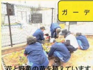
花と野菜の苗を植えています