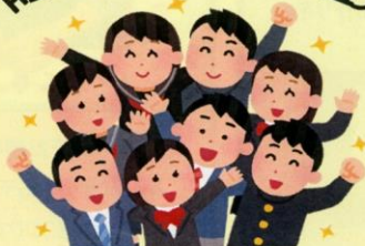
事務 ・ 印刷 班