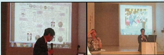
<小倉北区ニューロビン NRCC ホール>