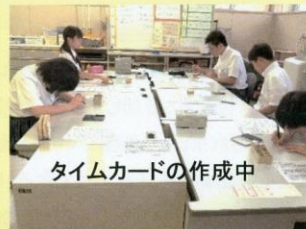
タイムカードの作成中