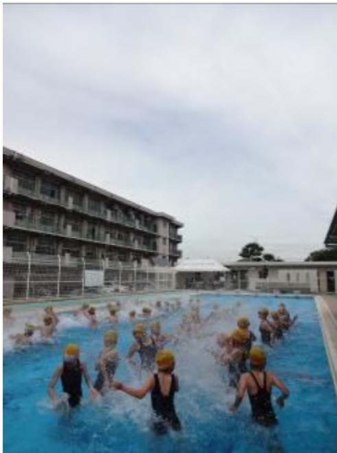
水しぶきに歓声が

6月18日(月)、プール開きが行われ、子どもの歓声が響き渡りました。5・6年生が参加し、今年のみあてを確認した後、いよいよ学習が始まりました。まだまだ冷たい水でしたが、それぞれのめあての達成に向けて、気持ちが高まりました。