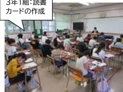
3年1組:読書カードの作成