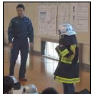
消防服の着用体験