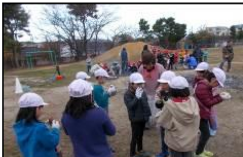
おいも、ほくほく、おいしいね。