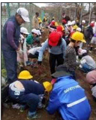
「ふるさと会」の方と一緒に