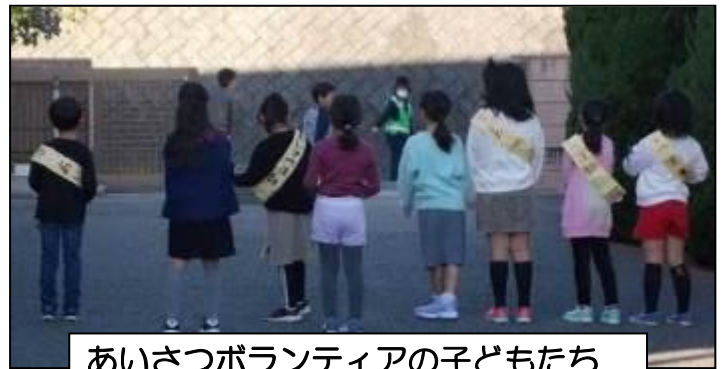
あいさつボランティアの子どもたち